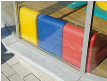
Fig. 2 Exemple de casse thermique sous l'influence de l'environnement interne